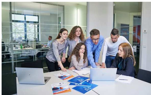
Figure professionali (sia per ragazze che ragazzi, f/m): sviluppatore, tecnico di sistema, collaboratore Helpdesk, support, projects, amministrazione, marketing, .....

sei entusiasta del mondo dell'informatica? Se vieni a trovarci, ti faremo conoscere da vicino le diverse professioni all'interno di un'azienda IT. Potrai incontrare i nostri collaboratori direttamente sul posto di lavoro, che ti presenteranno i loro ruoli e le loro attività quotidiane.